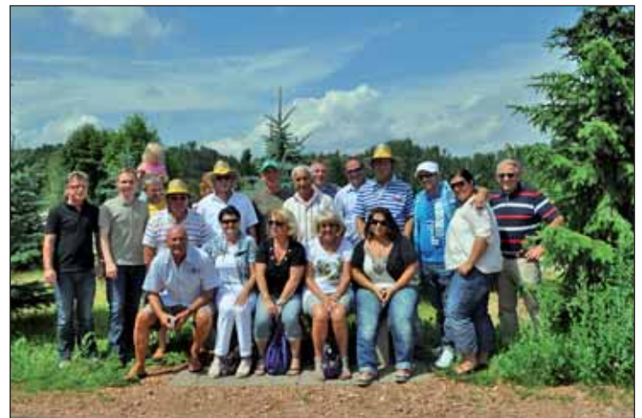
Gruppenfoto der Oberasbacher Fußballer beim Besuch des FAZ