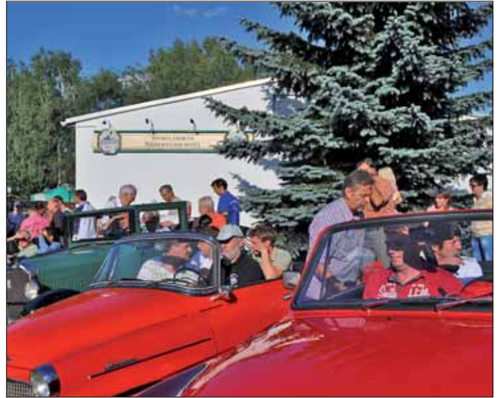
Die Prominentenauswahl startet zur Oldtimerfahrt