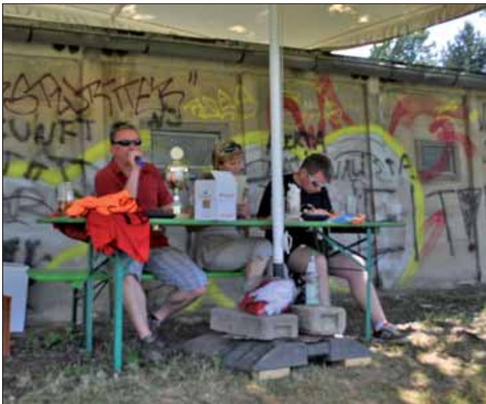
Das Org-Team beim Bürgermeisterturnier