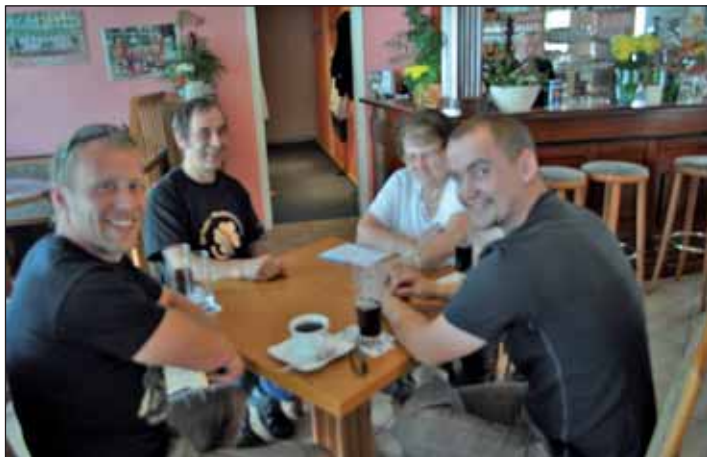
Teilnehmer des Skatturniers