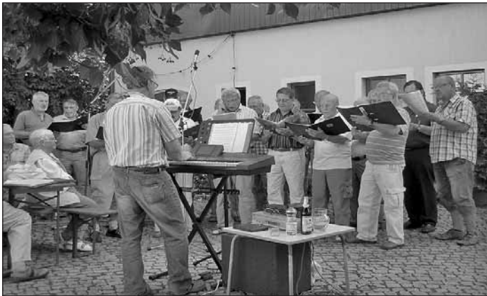
Männergesangverein „Sachsentreue“ Neuwürschnitz

sich alle Mitwirkenden und Gäste einig, im nächsten Jahr wieder mit dabei zu sein. Ein großes „Dankeschön“ gilt den Mitarbeitern des Eigenbetriebes der Gemeinde Niederwürschnitz für ihre Mithilfe bei der Organisation der Veranstaltung. Me.