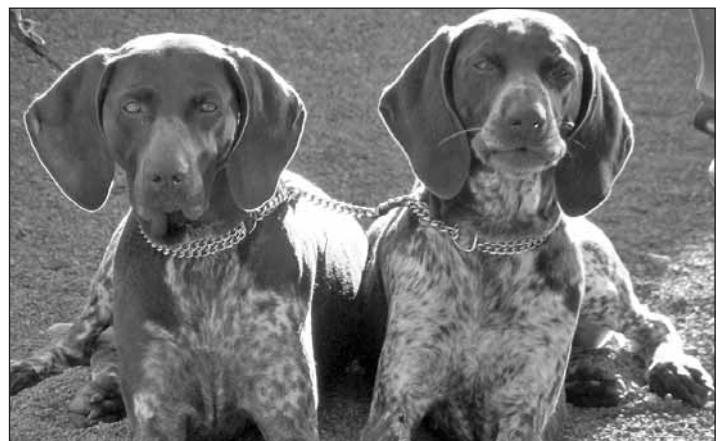
Zwei interessierte Zuhörer