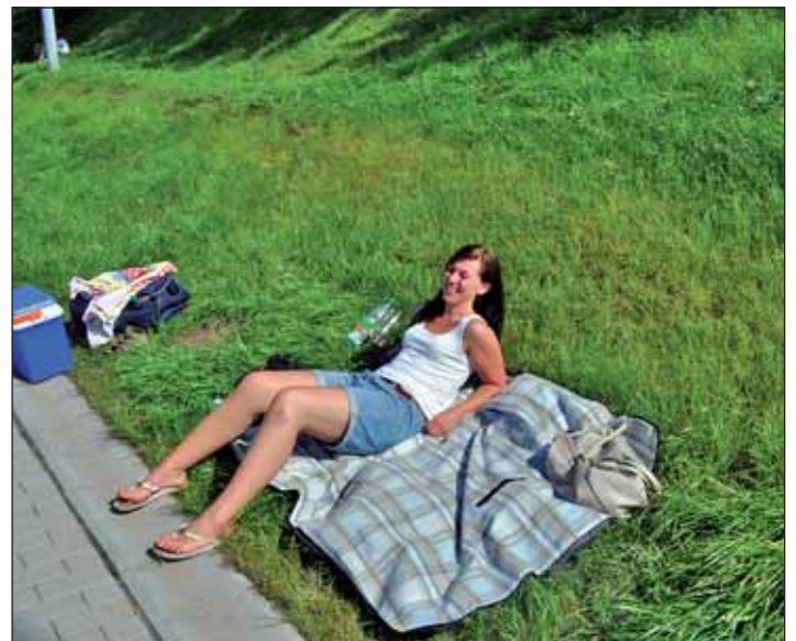
Es gab auch noch Schöneres als Fußball ...