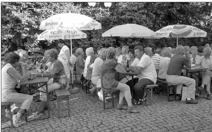
Gute Stimmung bei sonnigem Wetter