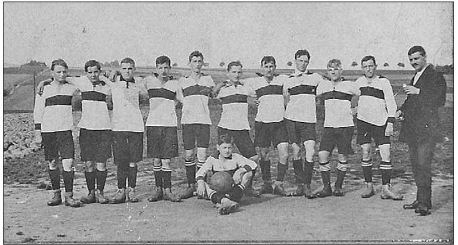
1 Mannschaft 1913