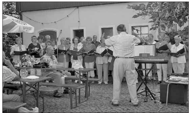
Volkschor „Frisch-Auf Niederwürschnitz“