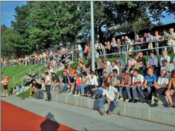
Gut gefüllte Zuschauertribünen beim Fußballspiel